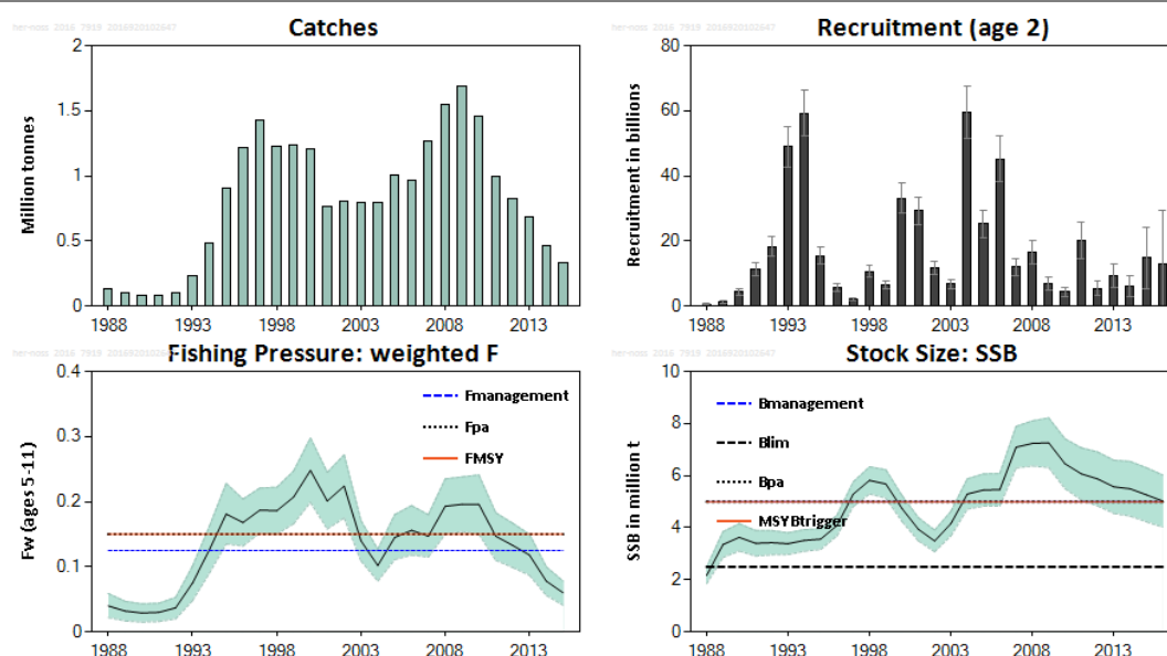
Takutitassiaq 2. a) 1979-2015-imut pisat tamakkiisut, b) takkussuuttut (ukioq ataasiunngitsoq utoqqaassusillit), c) aalisarneqarnerat d) suffisartunik peqassuseq

Peqassuseq appariartuaarpoq, maannalu peqassutsip nangiarnartumik inissif-figisinnaasatut taaneqartup (MSYBtrigger) qummut killissarititaa tikinneqaq-