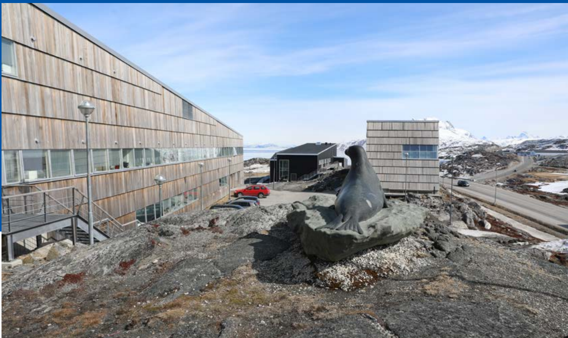
Pinngortitaleriffik anno 2018.