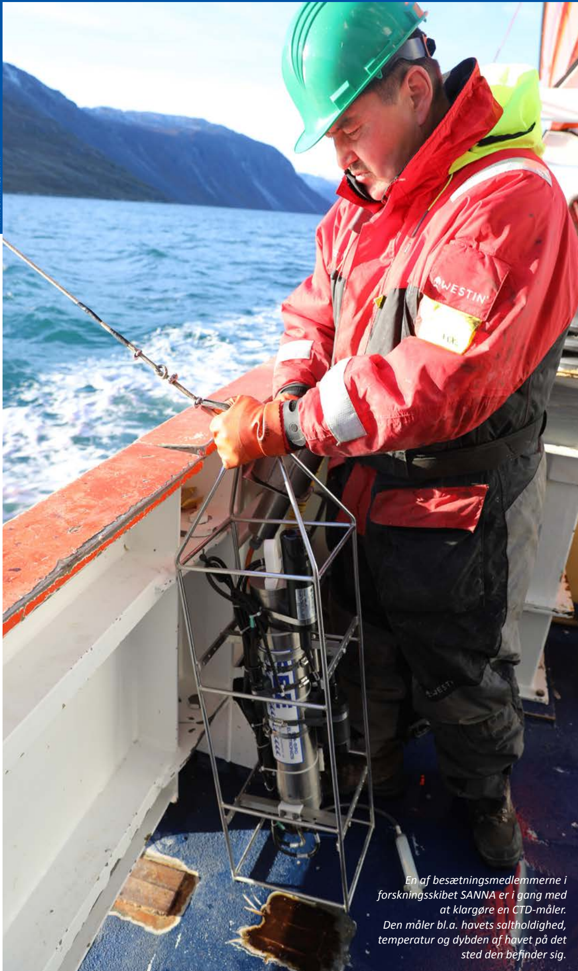
En af besætningsmedlemmerne i forskningsskibet Sanna er i gang med at klargøre en CTD-måler. Den måler bl.a. havets saltholdighed, temperatur og dybden af havet på det sted den befinder sig.