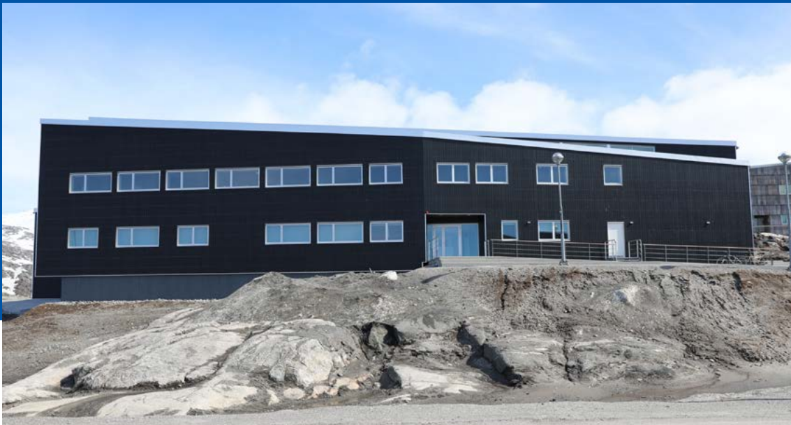
”Sidste skud på stammen” af Pinngortitaleriffiks bygninger, der huser Center for Naturvidenskabelige Uddannelser og Grønlands Center for Sundhedsforskning. Centerfaciliteterne blev taget i brug ved udgangen af 2017 og blev benyttet flittigt i 2018.